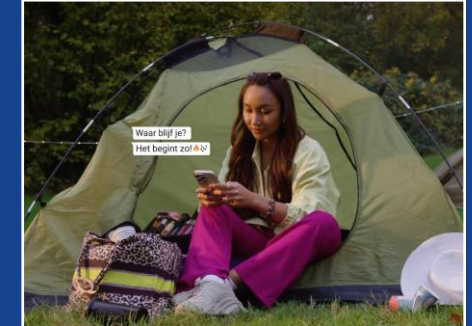
Powerbank, zie YouTube-link