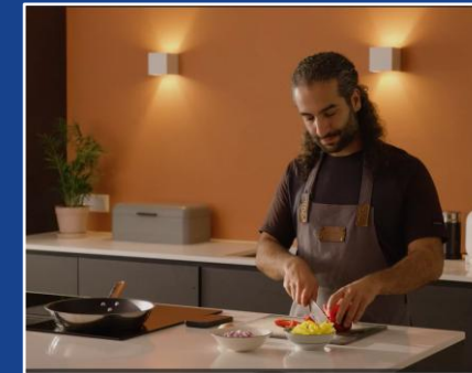
Houdbaar eten, zie YouTube-link