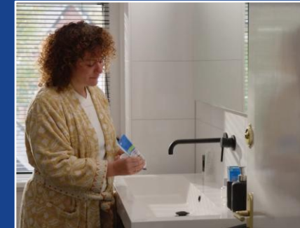
Flessen water, zie YouTube-link