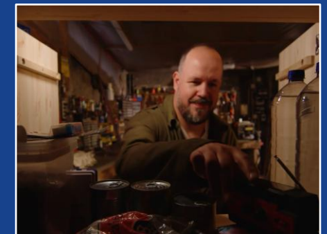
Noodradio's, zie YouTube-link