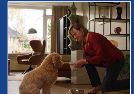
Dierenvoeding, zie YouTube-link